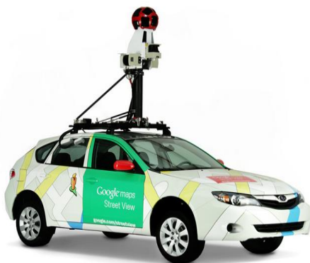
屋外版のストリートビュー