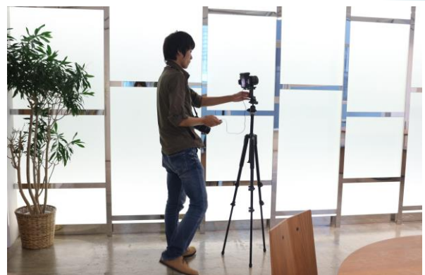
屋内版のストリートビュー

通常のストリートビューと異なり、三脚で固定した一眼レフのカメラで撮影を行います。